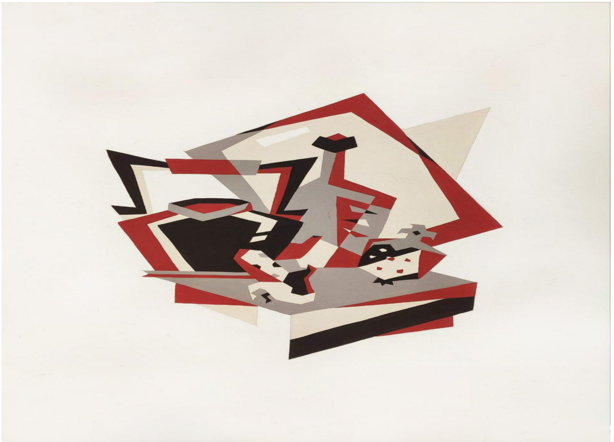
7.7. Пример экзаменационной работы второго этапа вступительных испытаний Композиция станковая: